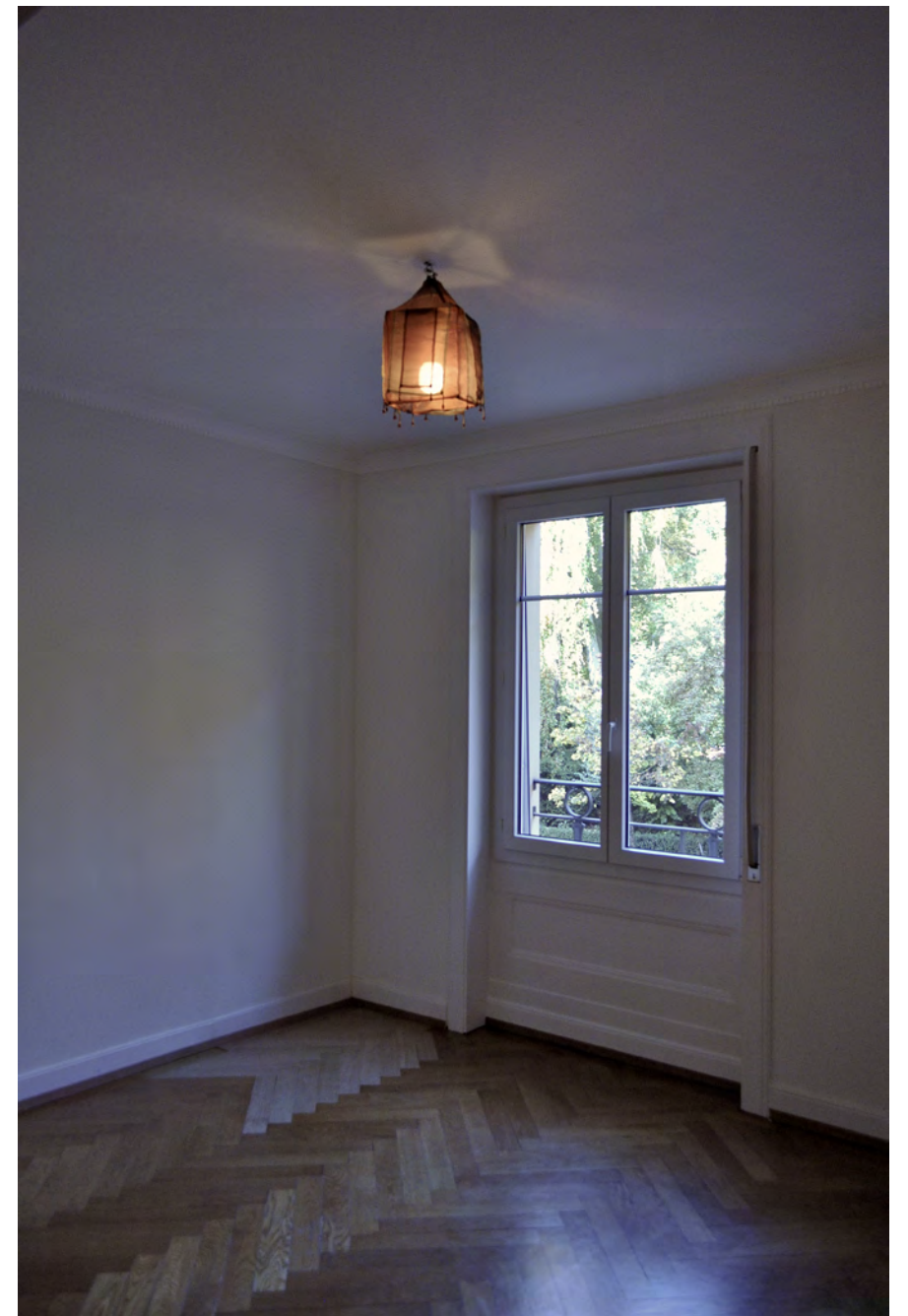
modification du hall et de l'entrée, chambre parentale (2 ème étape)